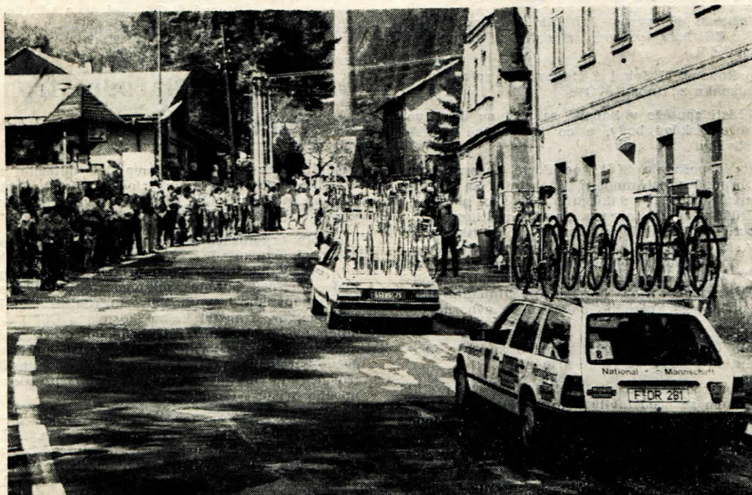
Závodníky ihned sledují doprovodné vozy s náhradními koly

Vydává OB při MNV Černý Důl jako čtvrtletník. Řídí redakční rada. Odpovědný redaktor Jan Mládek. Uzávěrka příštího čísla je 31. 10. 1989. Příspěvky zasílejte s kopií psané na stroji s mezerou jednoho řádku. Povoleno ONV Trutnov — OŠ pod č. o 6089. — Tisk VČT, provoz 22, Dvůr Králové nad Labem