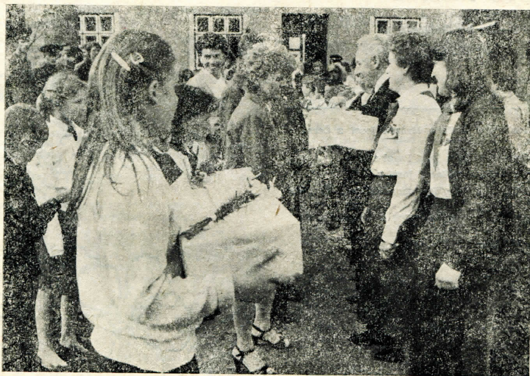
Veřejné ocenění zasloužilých pionýrských pracovníků ke 40. výročí založení PO SSM