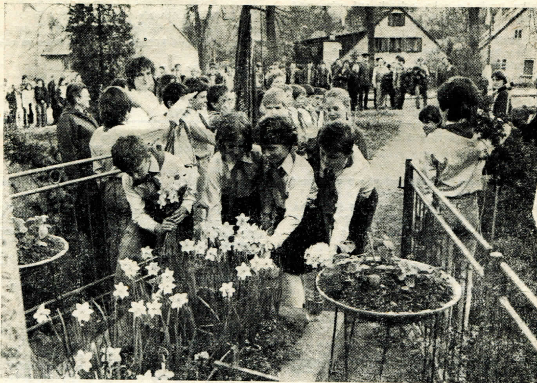
Jako první uctili památku naši pionýři